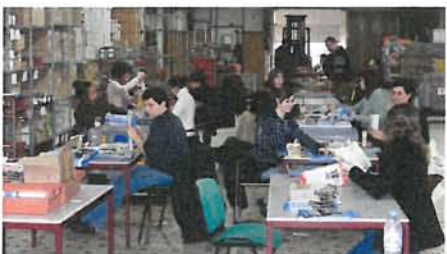
Plusieurs opérations de mise sous pli ont eu lieu au Pallet dans le cadre des élections. Mais celle-ci, par le nombre de personnes à recruter, est une première.

Vignoble nantais/Gé-tigné. C'est déjà ça. La campagne électorale dont le cœur bat au rythme des mesures pour l'emploi va donner... quelques jours de travail. Dans le cadre des élections présidentielles et législatives, la société Asap Diffusion, entreprise spécialisée dans la préparation de documents, recrute en effet 900 personnes pour effectuer une importante opération de mise sous pli des professions de foi des candidats organisée dans le secteur de Clisson. L'entreprise n'a pas souhaité donner le lieu précis pour des raisons de sécurité.